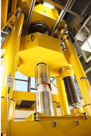
Bild 1: Zugkraftkalibrierung 10 MN mit kundeneigenen Gewindehülsen sowie laboreigenen Zugstäben

Alle Text- und Bilddateien stehen Ihnen honorarfrei unter www.u3mu.com/gtm in druckfähiger Qualität zur Verfügung